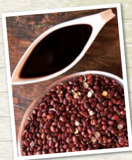
いなご豆とキャロブシロップ

大量購入、業務用一括購入等のご希望がございましたら 営業本部までご相談ください。