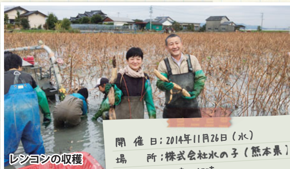
開催日: 2014年11月26日(水) 場所: 株式会社水の子(熊本県) 時間: 10時~15時

コーレンとなる部分は、節の両端から1.5cm、計3cmのレンコンの節、生命力の塊である芽と、加工用として出荷するには、短い部分をカッターにかけていきます。カッターにかけられ、細くなったレンコンを地下水で10分丁寧に洗い、泥と砂を落としていきます。さらに桶の中で振り洗いし、丁寧に洗浄されたレンコンは、網に移され均一にならされた後、乾燥機に一晩かけられます。乾燥後さらに1週間乾燥され、品質を安定させたのちに、粉に挽かれます。